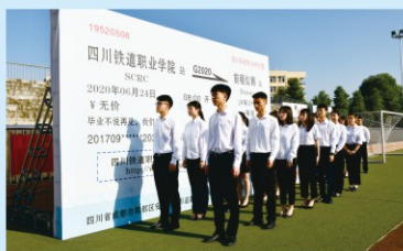
七十年来学校培养了十万余名毕业生